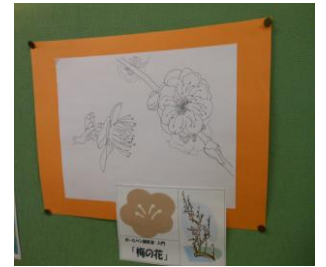
ボールペン画教室 課題例

次のとおり、平成25年度の事業計画を策定しております。事業計画に沿って、「明るく・楽しく・元気よく」をモットーに、より一層利用しやすい施設となるよう努めてまいりますので、皆様のご理解とご協力を賜りますよう、よろしく願いたします。