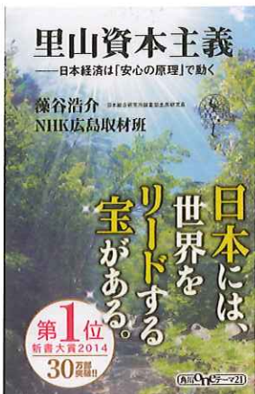
里山資本主義(角川Oneテーマ21)

1964年、山口県生まれ。88年に東大法学部を卒業し、日本開発銀行(現・日本政策投資銀行)入行。米国コロンビア大学ビジネススクール留学、日本経済研究所出向などを経て日本総合研究所主席研究員、日本政策投資銀行特任顧問。平成の大合併前の約3200市町村のほぼすべてを訪れ、地域復興や地域経済の分野で研究・著作・講演を重ねている。2012年より現職。公職やテレビ出演多数。